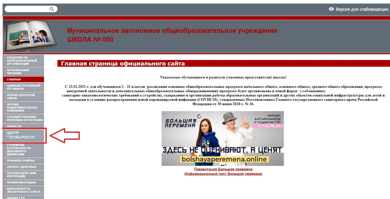
Рисунок 2. Пример размещения ссылки на раздел на сайте общеобразовательной организации

На официальном сайте общеобразовательной организации, в которой создается центр образования естественно-научной и технологической направленностей «Точка роста» (далее – центр «Точка роста», центр) в рамках федерального проекта «Современная школа» национального проекта «Образование», не позднее даты начала функционирования центра (не позднее 1 сентября года создания центра) создается раздел «Центр «Точка роста». Ссылка на раздел размещается в главном меню сайта общеобразовательной организации и должна быть видима при просмотре каждой страницы. Ссылка не может являться вложенной в другие меню. Пример размещения ссылки на раздел «Центр «Точка роста» в меню официального сайта общеобразовательной организаций в информационно-телекоммуникационной сети «Интернет» приведен на рисунке 2.